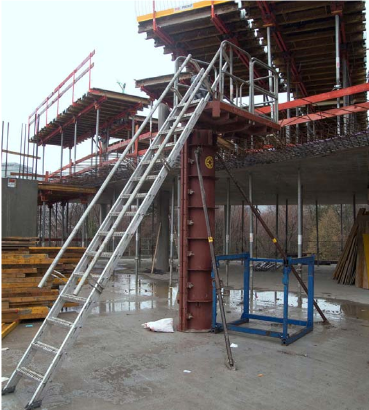
BU: STAFE-Steiltreppe im Einsatz beim BV Duale Hochschule Stuttgart – Ed. Züblin AG