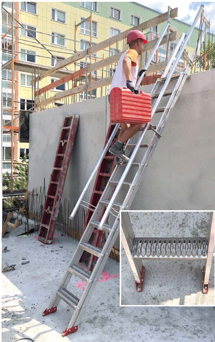
BU: Sicherheit steht an erster Stelle! STAFE-Steiltreppe beim BV „Dolgensee-Center, Berlin – MBN Bau AG