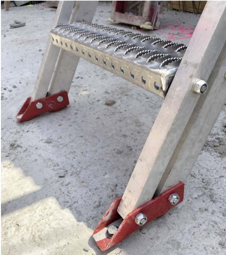
BU: Stufen aus rutschsicherem Profilrost mit gezahnter Oberfläche (RH R13)