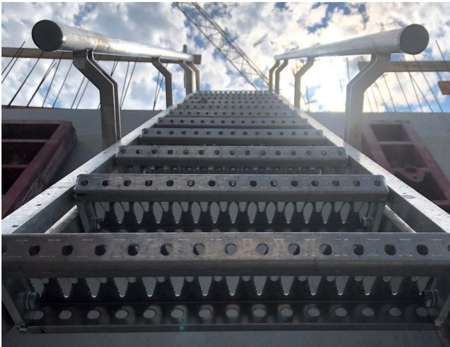
BU: Sicherer Halt auf Schritt und Tritt: Immer waagerechte Trittstufen - unabhängig von der Neigung - und mit der Steiltreppe fest verbundene Handläufe.