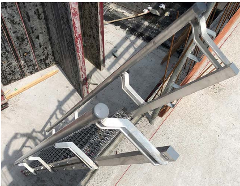
BU: Detail: Überstehende Handläufe (mind. 1 m) ermöglichen den sicheren Ein- und Ausstieg innerhalb der Steiltreppe