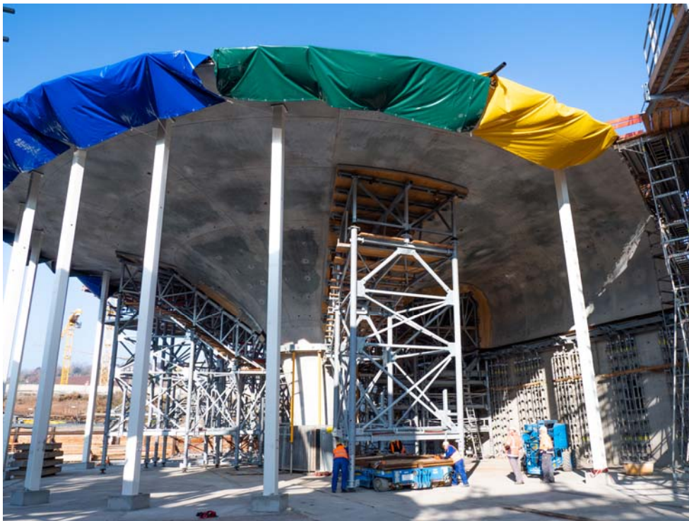
BU: Ausschalarbeiten am ersten Randkelch: Dank Schwerlast-Plattformwagen gelingt das Umsetzen der tonnenschweren Rüsttürme mühelos.