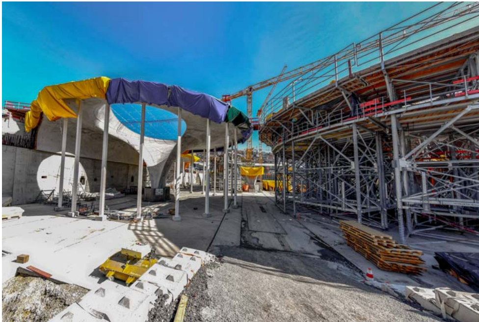
BU: Meilenstein 2019: Der erste Randkelch, der im Dezember 2018 ausgeschalt wurde (links) und der erste Regelkelch, der eingerüstet ist (rechts).