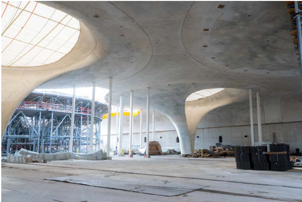
BU: Imposante Architektur: Schwindgassen, die Deckenfelder zwischen den Kelchen, verbinden die unterschiedlichen Kelchformen miteinander.