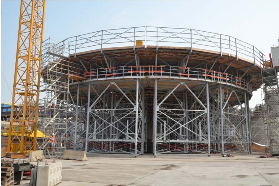
BU: Spezialentwicklung im Ersteinsatz: Die komplett eingeschaltete Unterrüstung für den ersten Randkelch.